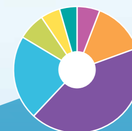
Energietabels woningen per 31 december 2011