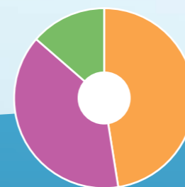
Oplevering nieuwbouwwoningen 2011

73 Sociale huur 60 Vrije sector huur 21 Koop